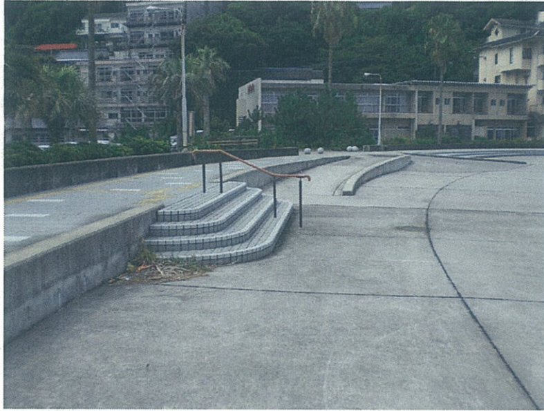
現況(駐車場前付近)